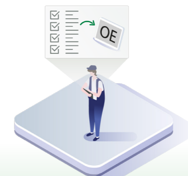
↑ Service overføres automatisk til bilprodusentens serviceportal.