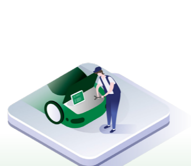
↑ Service utføres og registreres i macsDIA.