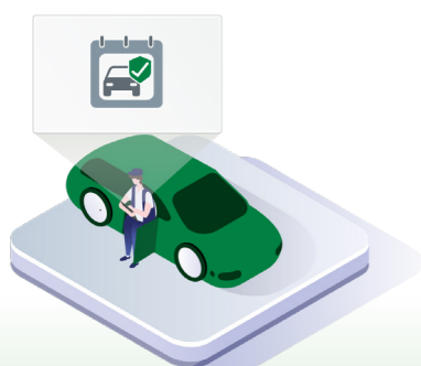
↑ Kundebehandlingssystemet – bilen registreres.