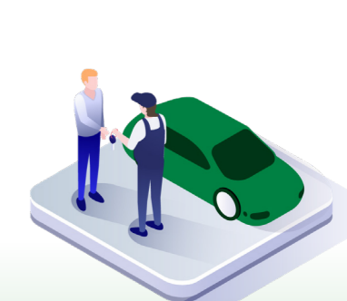
↑ Bilen utleveres til kunden.